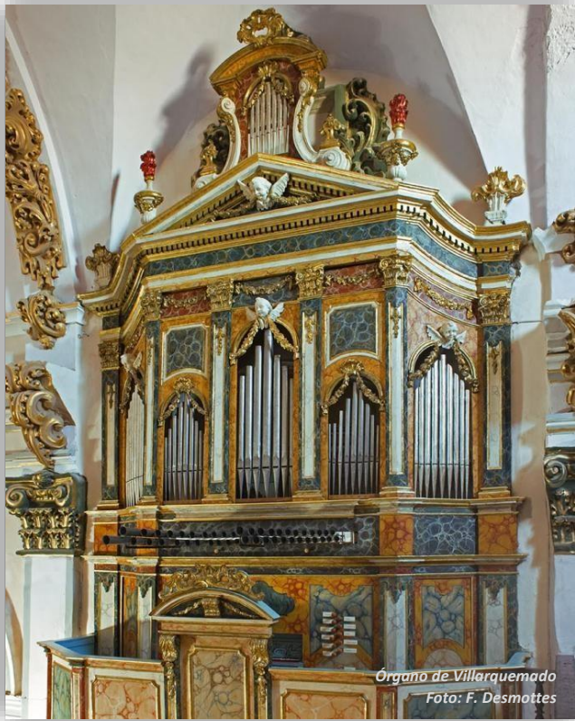
Órgano de Villarquemado